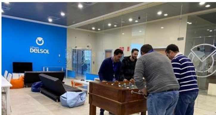
Interior de las oficinas de Software Delsol

Pareja habla de aumento de costes para las compañías. «Una reducción de 20% del tiempo trabajado manteniendo los salarios, puede incrementar los costes salariales en aquellas actividades que no dependen tanto de la motivación y cumplimiento de objetivos individuales, sino de cobertura de actividad por turnos o de horarios de apertura o atención a clientes», remarca. Sobre si es posible su aplicación, la senior manager de PeopleMatters explica que «podría ser viable en empresas o sectores concretos, pero no es generalizable a todos y, más en España donde el sector servicios tiene un peso muy elevado» . «Hay otras alternativas como la flexibilidad, que no implican acortar la semana laboral un día, pero sí aportan ventajas o beneficios similares y palían las desventajas de una medida como ésta», argumenta.